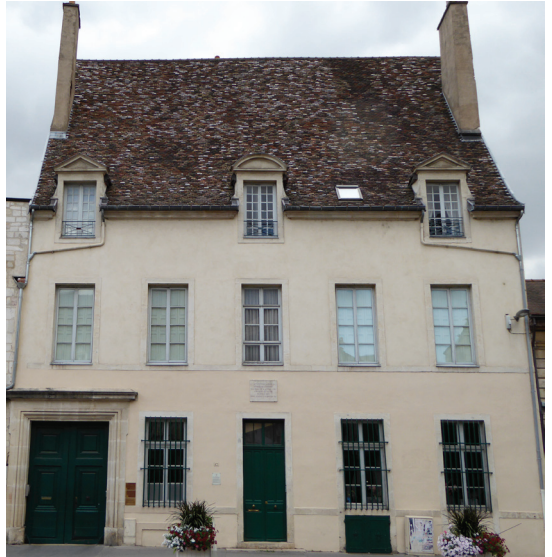
Hôtel Guyton de Morveau, 17 Place Bossuet