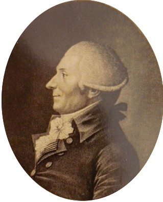
Louis-Bernard Guyton de Morveau © BM Dijon EST 3064